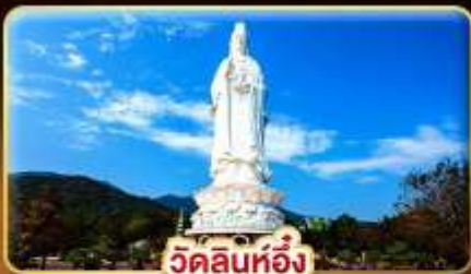
วัดลินห์อึ้ง