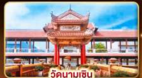
วัดนามเชิน