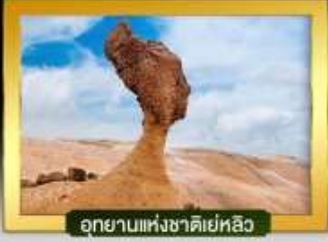
อุทยานแห่งชาติเยลโลว์