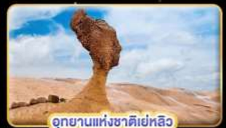
อุทยานแห่งชาติเย่หลิว