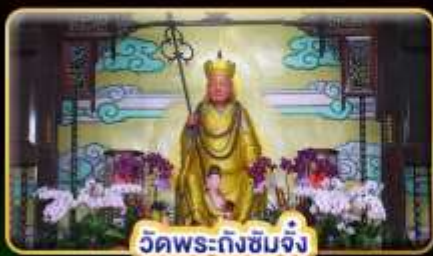
วัดพระถังซำจั๋ง

"ล่องเรือทะเลสาบสุริยันจันทรา" ขอความรักวัดหลงซาน